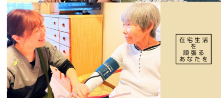
在宅生活を頑張りなあなたを