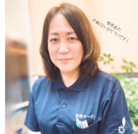
看護師の 「笑顔は最高の声です！」

ご利用者様の、そんな気持ちに寄り添って私たちにできる限りのお手伝いをさせていただきたいと考えています。 ケアマネジャーや主治医と連携し、 看護師・リハビリの専門士が直接ご訪問 して地域の皆さんが住み慣れた場所で生活する上で必要なサービスを受け「 笑顔で毎日を暮らし続けられる 」よう努めていきます。